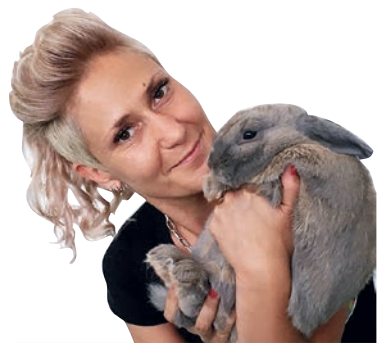
Piše Lea Kreszinger, dr. vet. medicine Veterinarska klinika Kreszinger www.klinika-kreszinger.com

Ako ne provodite većinu slobodnog vremena u prirodi, nego ste vezani za stan ili posao, ne razmišljajte o velikoj pasmini, terijeru ili pograničnom koliju. Mali psi i mačke više odgovaraju gradskom užurbanom načinu života